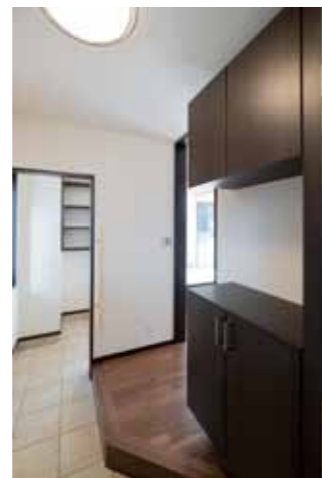
◀玄関は二つの空間が繋がり、奥のエリアはわんちゃんスペースとしてゲージなど設置できます。