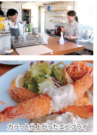
カラッと仕上がったエビフライ