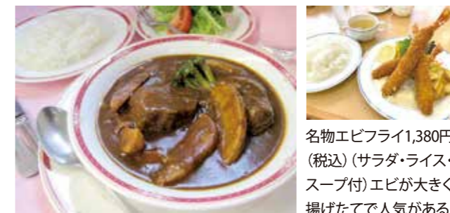
名物エビフライ1,380円(税込) (サラダ・ライス・スープ付) エビが大きく揚げたてで人気がある

隊員は北海道から沖縄まで食文化の異なる出身者があつまります。そのなかで誰からも受け入れられる献立としてビーフシチューは人気だったそう。アツアツの料理を味わいながら南極へと思いを馳せてみてはいかがでしょうか。