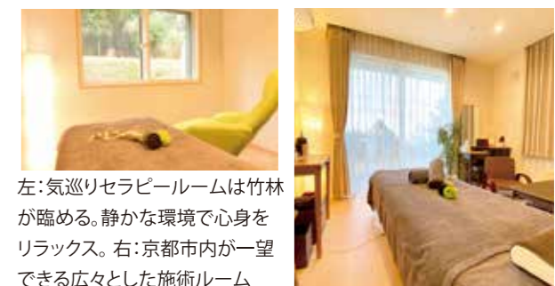
左:気巡りセラピールームは竹林が臨める。静かな環境で心身をリラックス。右:京都市内が一望できる広々とした施術ルーム