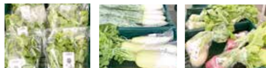
花菜をはじめとした新鮮野菜を用意してお待ちしています！